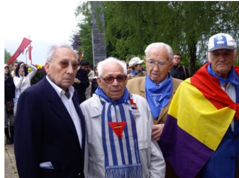
Mayo 2008