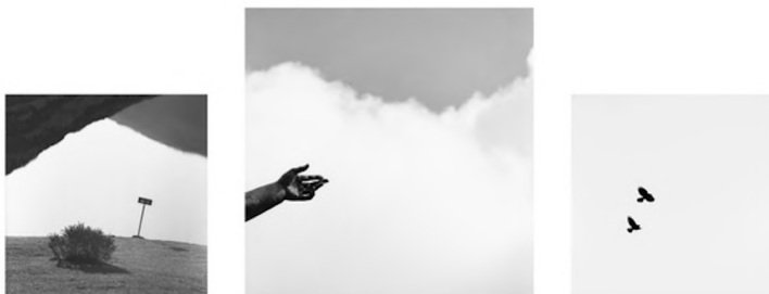
Sin título. 2022 Fotografía. 100x250 cm

José Ferrero deriva el objeto artístico al territorio poético, filosófico y comunicativo. Le interesa el tiempo propio de la imagen, la presencia del autor en el proceso y lo no visible: la representación frente a la realidad y viceversa. Provoca la fantasía y la memoria del espectador para recomponer conceptos como lugar, tradición, identidad, naturaleza/ecosistema, historia y creencias. Artista y comisario, ha realizado exposiciones en Europa, Latinoamérica y EEUU.