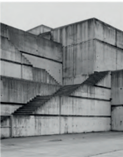
Sin título. 2022 Fotografía. 125x100 cm