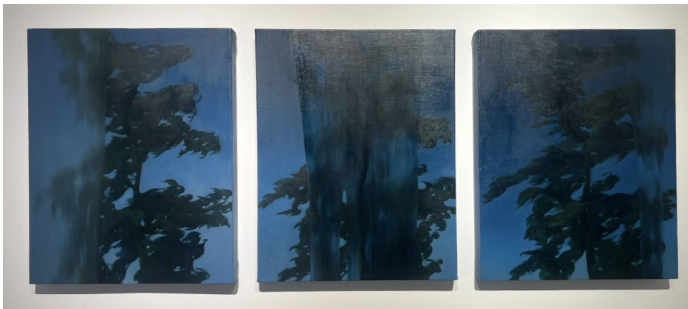
Deep blue shadow. flowing rain. 2024 Óleo sobre lienzo. 50x120 cm

Yin Liang estudió pintura en la Academia (CAFA) y es profesor en la Universidad Forestal de Pekín. Su trabajo enfoca los momentos inmóviles y las cosas mundanas, tratando de tocar las emociones y las historias que les pertenecen, en las que descubre una inmensa energía y huellas conmovedoras. En su serie Paisajes, la imaginación más objetiva parece esconder un orden misterioso y suscita la reflexión sobre el orden, las emociones y la poesía visual de las imágenes.