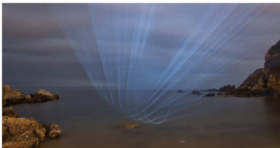
RC LI. 2020 Fotografía. Intervención sobre el paisaje. 97x170 cm

Javier Riera documenta sus proyecciones de luz y geometría sobre la vegetación de bosques, jardines y espacios públicos. Sus obras, próximas al Land Art, intervienen sobre el tiempo y el espacio del paisaje, implicando al público en un efecto modificador y meditativo. Riera entiende la geometría como un lenguaje natural anterior a la materia, capaz de establecer un tipo de resonancia sutil y reveladora. Ha realizado proyectos en Francia, Italia, China, España, Dinamarca, Reino Unido, EE. UU, Croacia, Rumanía, República Checa, etc.