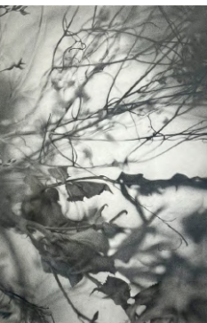
2 it and her body. 2013 Grafito sobre papel. 75x55 cm

La práctica artística de Guo Tianyi indaga sobre la vida y su temporalidad. Utiliza los «objetos» como medio para explorar distintas relaciones y diversas experiencias vitales. La relación entre arte y naturaleza es un tema que analiza a través de nuestra historia creativa, invitándonos a considerar la interacción entre la expresión humana y el mundo orgánico.