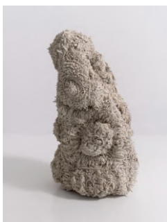
She's growing n°1. 2023 Algodón y lana. 100x45x25 cm

Lin Fanglu es una consumada artista y diseñadora con una sólida formación en bellas artes. Su trayectoria la llevó a explorar el folclore de las minorías étnicas chinas, en particular las técnicas de teñido y tejido tradicionales, incorporándolas a su obra y superando los límites del arte y el diseño. Con numerosas exposiciones en todo el mundo, ha obtenido el prestigioso Loewe Foundation Craft Prize en 2021.