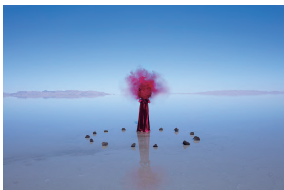
Rito I. 2019 100x150 cm

Con una gran carga simbólica, Soledad Córdoba explora las fronteras entre realidad y ficción e indaga en el dolor, en los procesos de sanación y en los estados del alma. Nos sorprende la naturaleza que reina en sus paisajes extraordinarios y singulares que invitan a la reflexión. Su obra —solemne, misteriosa y bella—, ha sido premiada por centros de prestigio como la TATE Britain o la Casa de Velázquez, y se ha expuesto en Europa, Reino Unido, EE.UU., Japón, México, Colombia, Irán, Marruecos.